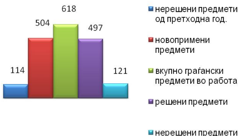
граѓански оддел -предмети во работа